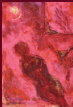
Les femmes, les Arts et les Sciences Les Chemins Buissonniers

Hall de la Maison de la Recherche - accès libre