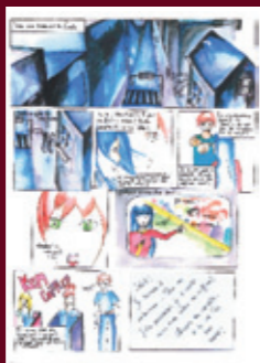
Les métiers ont-ils un sexe ? URCIDFF Midi-Pyrénées